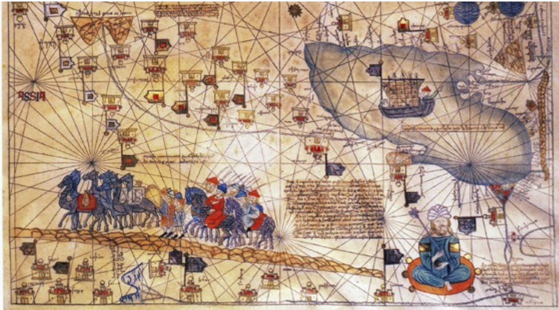
Carovana sulla via della seta; Atlas Catalan, 1375 ca.